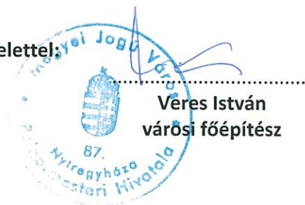
Véres István városi főépítész